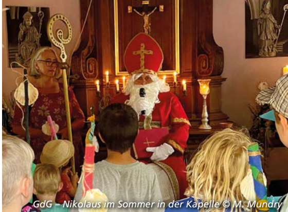
GdG – Nikolaus im Sommer in der Kapelle