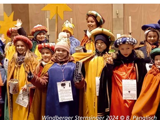
Windberger Sternsinger 2024