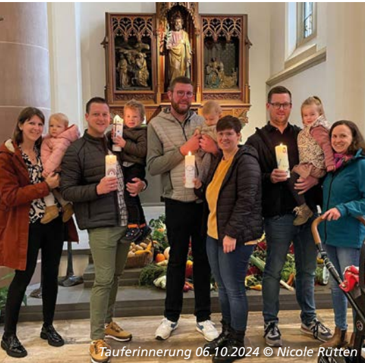
Tauerinnerung 06.10.2024