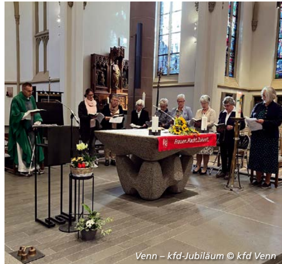
Venn - kfd-Jubiläum