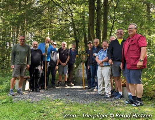
Venn – Trierpilger