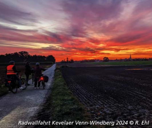
Radwallfahrt Kevelaer Venn-Windberg 2024