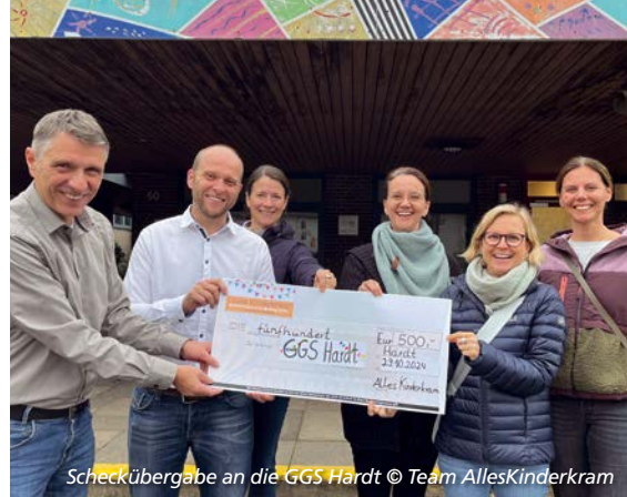
Scheckübergabe an die GGS Hardt