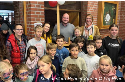
Spendenlauf Hehner Kinder