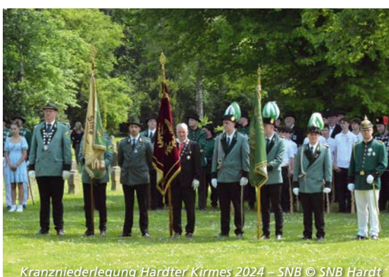
Kranzniederlegung Hardter Kirmes 2024 – SNB © SNB Hardt