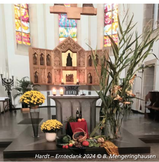
Hardt – Erntedank 2024