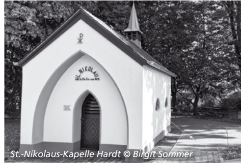
St.-Nikolaus-Kapelle Hardt

In diesem Jahr findet vom 28. Mai bis 04. Juni die Heiligtumsfahrt in Mönchengladbach statt. Es wurde angeregt, am Abschlusstag, dem 04. Juni, in den einzelnen Stadtteilen Stadtteilstadtteilgottesdienste, möglichst in ökumenischer Form, zu feiern. Der Pfarreirat St. Nikolaus hat diese Anregung aufgegriffen. So findet am Dreifaltigkeitssonntag, den 04. Juni 2023, ein ökumenischer Gottesdienst in der Anlage an der Nikolauskapelle am Piperlohof statt. Der Gottesdienst beginnt um 11.30 Uhr. Im Anschluss daran sind alle eingeladen, zum Abteiberg am Münster zu kommen, wo ab dem Mittag ein Abschlussfest der Heiligtumsfahrt stattfindet,