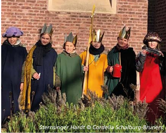
Sternsinger Hardt