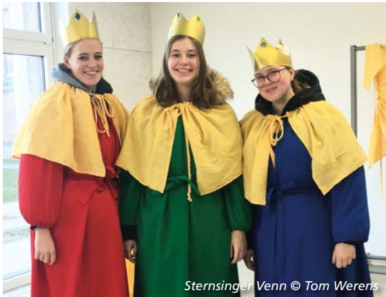
Sternsinger Venn