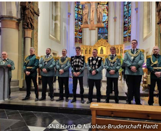
SNB Hardt