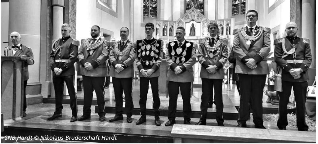
SNB Hardt