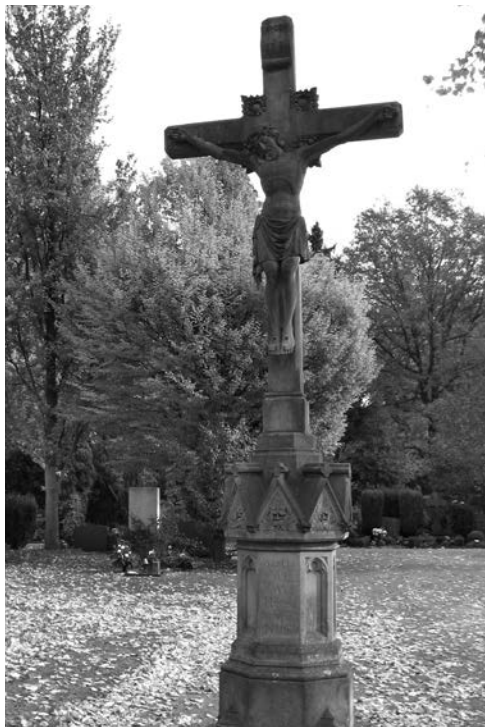
Friedhofskreuz Hardt

Der Bildhauer Buyten aus Kempen erhielt im Sommer 1863 vom Kirchenvorstand den Auftrag, das Kreuz herzustellen. Nach Vorlage eines Zeichnungsentwurfs von Buyten wurde vom Kirchenvorstand ein Vertrag über 292 Thaler abgeschlossen. Der noch nicht durch die Stiftung erbrachte Betrag wurde durch weitere Kollekten von den Gläubigen gespendet. Das Kreuz sollte Mitte Oktober auf dem neu angelegten Friedhof aufgestellt werden. Nachdem die Nivellierung der Fried-